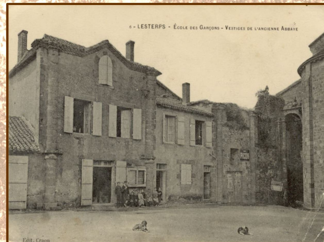
L'école de garçons au XIX e siècle, à l'emplacement de l'ancien transept de l'église. Carte postale, collection privée.