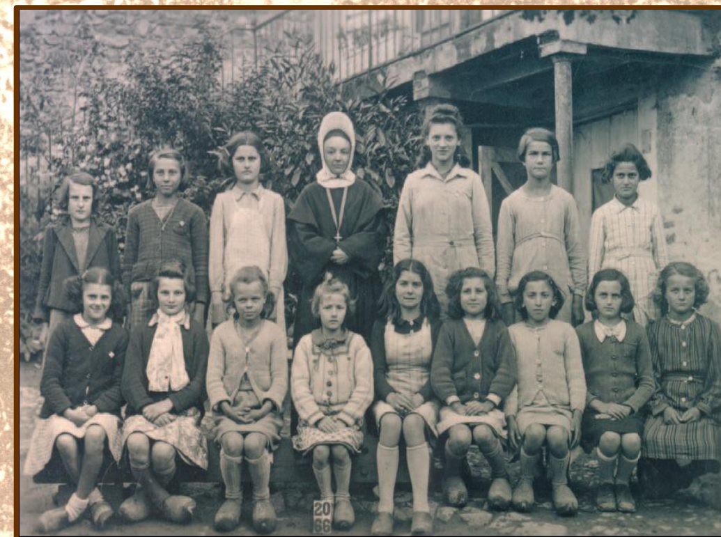
Photo de classe de 1948 : les grandes Photo ancienne.