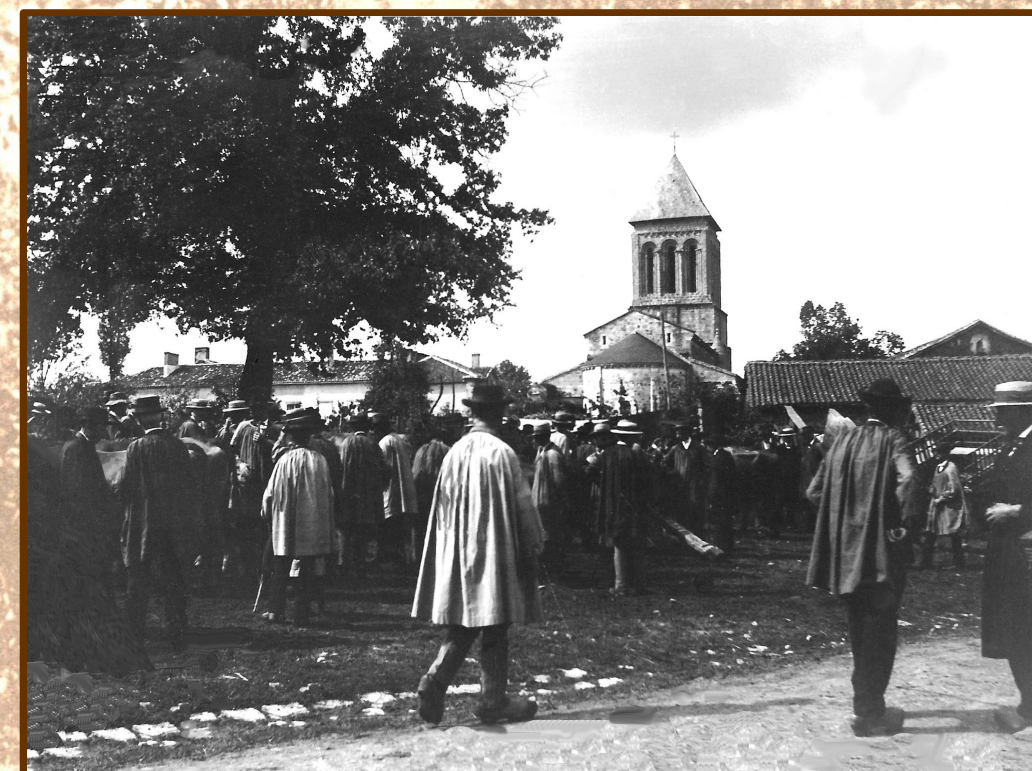
Un jour de foire à Lesterps