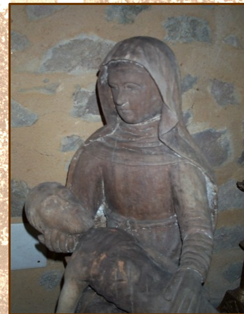
Détail de la Pietà du XVII e qui se trouvait dans la chapelle.