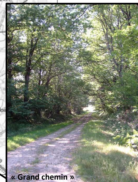
« Grand chemin »