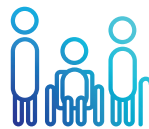
SOLIDARITÉS HUMAINES (PERSONNES ÂGÉES, PERSONNES HANDICAPÉES, INSERTION, FAMILLE ...)