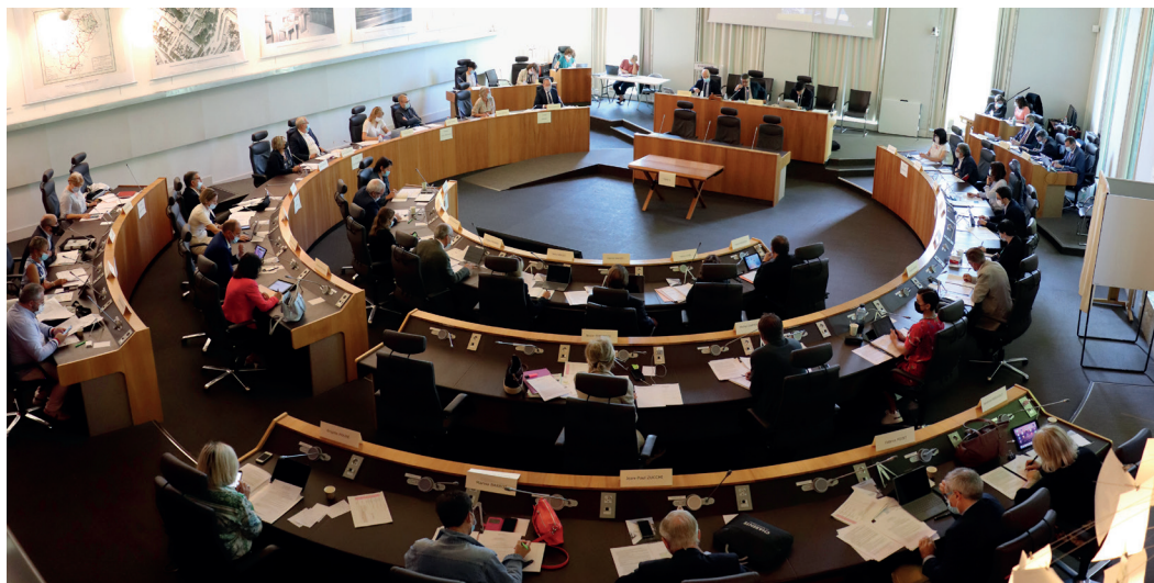
L'Assemblée départementale 2022.