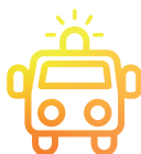
SERVICE DÉPARTEMENTAL D'INCENDIE ET DE SECOURS